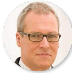
Marc Däumler Excognito - Agentur für Kommunikation www.excognito.de